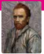
森村泰昌 《自画像の美術史(ゴッホ/青)》 2016年 作家蔵

【会場】国立国際美術館 【時間】10時～17時 金曜日は19時まで (入場は閉館の30分前まで) 【休館日】月曜日(ただし5/2(月)は開館) 【お問い合わせ】06-6447-4680